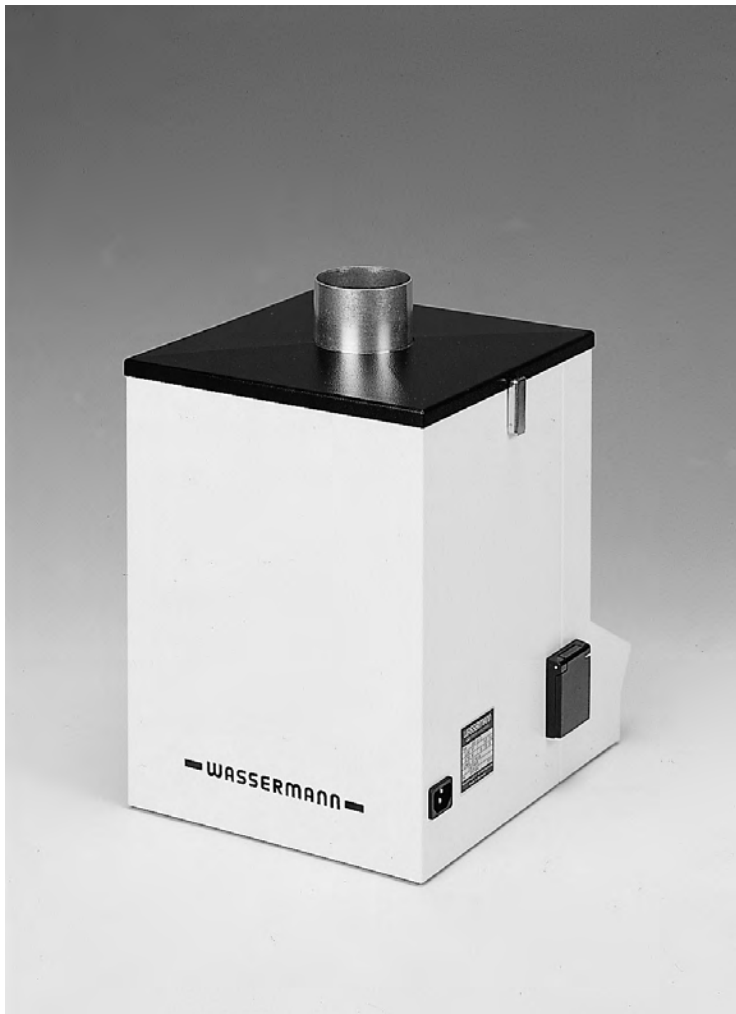
Abb.: SG 1/1