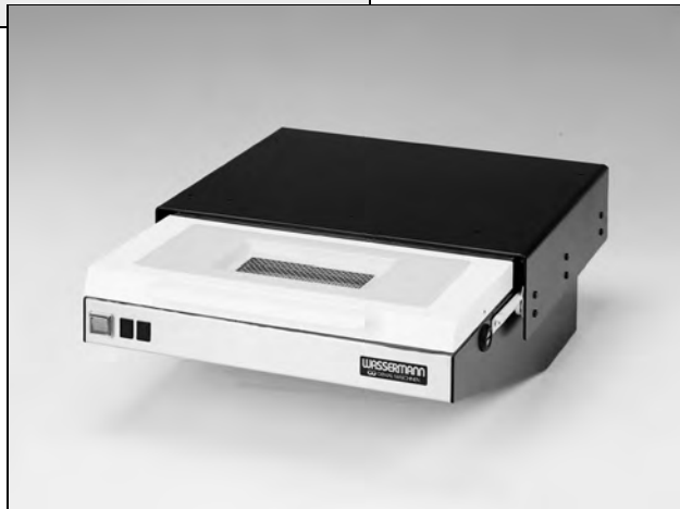
Abb.: LSG-02 DE