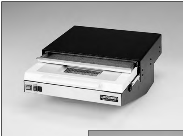
Abb.: LSG-02 D