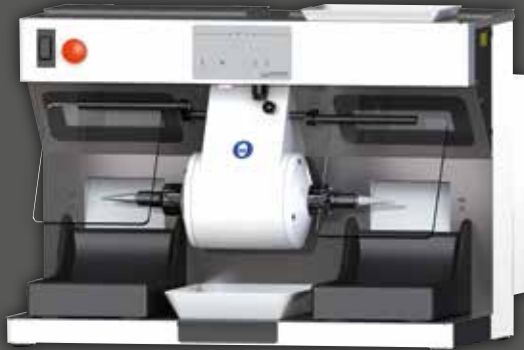
WP-Ex 2000 II (2 Schaltstufen, 1500 / 3000 min -1 ), Grundausrüstung

Wassermann Dental-Maschinen GmbH Rudorffweg 15-17 · 21031 Hamburg · Deutschland Tel.: +49 (0)40 730 926-0 · Fax: +49 (0)40 730 37 24 info@wassermann-dental.com · www.wassermann.hamburg