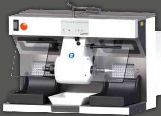
WP-Ex 2000 II mit Sonderzubehör Tageslicht-LED-Spot und Ansaugschutzgitter